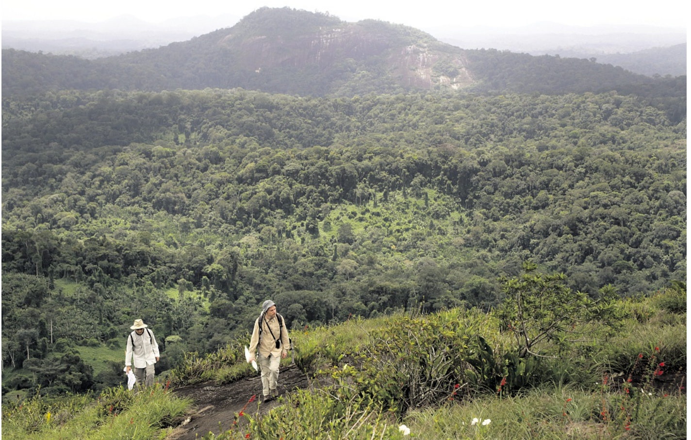
Deux entomologistes du programme « La planète revisitée » à la recherche de nouvelles espèces sur l'un des inselbergs du Mitaraka (Guyane). HANN CHAVANCE